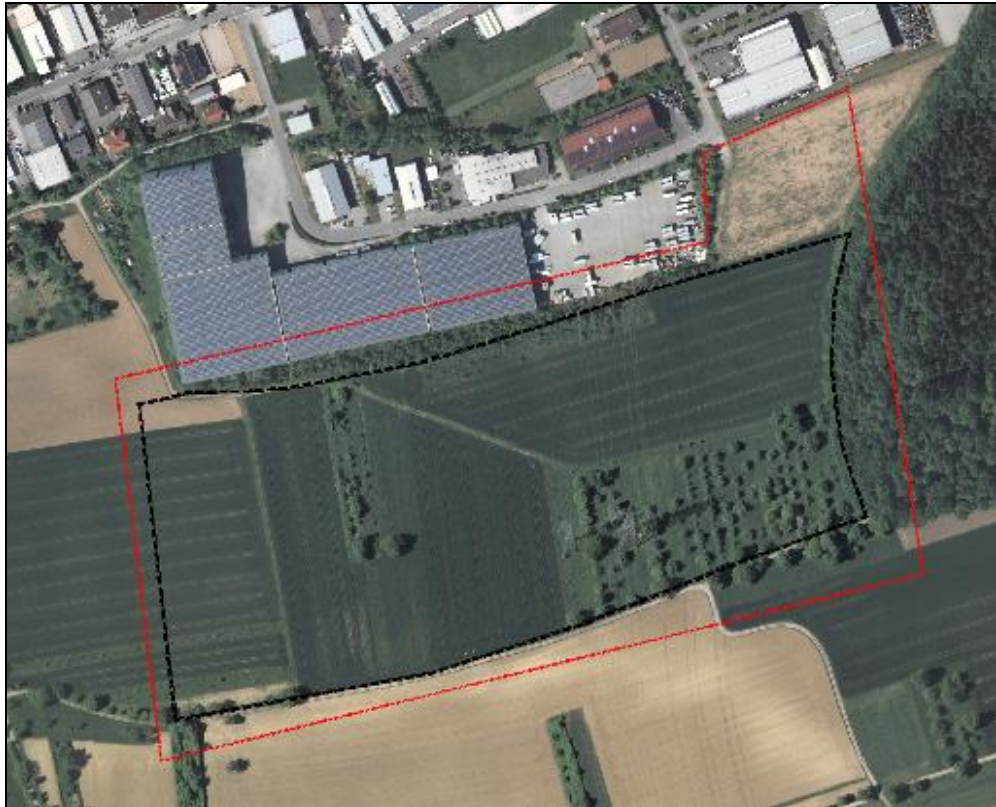
Abbildung 2: Untersuchungsraum mit Geltungsbereich des Bebauungsplans

Auf der nachfolgenden Abbildung ist der vorläufige Untersuchungsraum für die Relevanzuntersuchung mit Habitatpotenzialanalyse (rot umrandet) und der Geltungsbereich des Bebauungsplans „Industriegebiet Gölshausen VII. Abschnitt“ (schwarz umrandet) abgebildet.