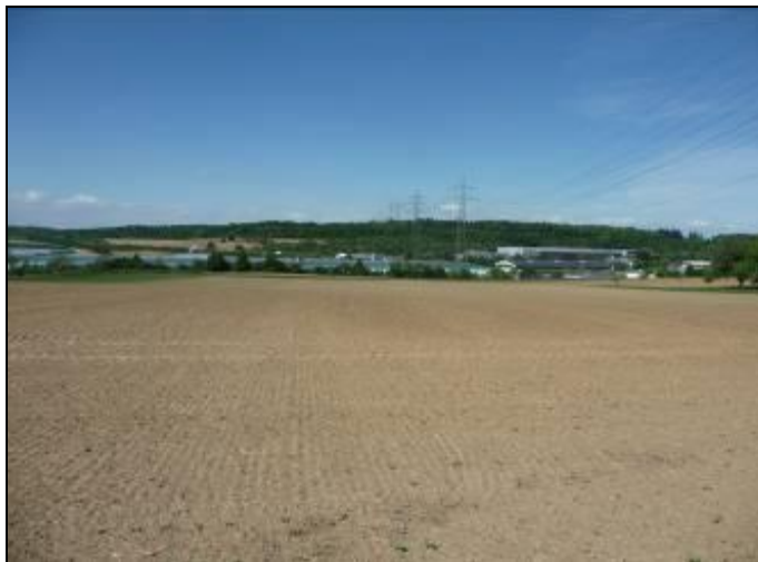
Abbildung 3: Blick auf die Ackerflächen in Richtung Norden

Durch die intensive Nutzung sind die Ackerflächen als ein mäßiges Nahrungshabitat für Vögel anzusehen. Im Grünland konnten keine Wirtspflanzen für geschützte Tag- und Nachtfalter vorgefunden werden. Unmittelbar westlich des Geltungsbereiches gibt es einen Hohlweg. Die Böschungsbereiche sind Lebensräume der Zauneidechse.