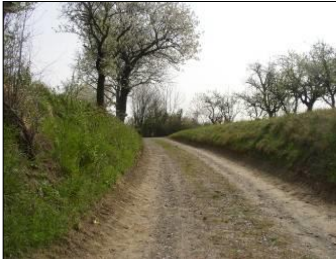
Abbildung 4: Blick auf den Hohlweg