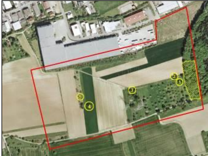
Abbildung 6: Übersicht der relevanten Höhlenbäume

(mit Nummern versehen); am Waldrand waren einige ältere Bäume mit Spalten vorhanden (schraffierter Bereich)