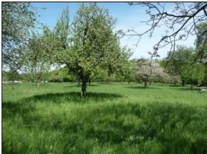
Abbildung 5: Blick auf den südöstli- chen Streuobstbestand

Aufgrund ihres Früchte- und Insektenreichtums sind die Gehölze als ein Nahrungshabitat für die lokalen Vogelpopulationen einzuordnen.